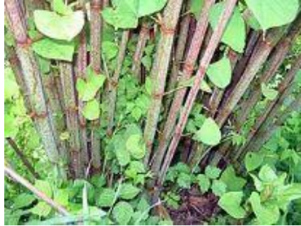
Tiges de renouée.