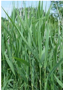
Tiges de phragmite